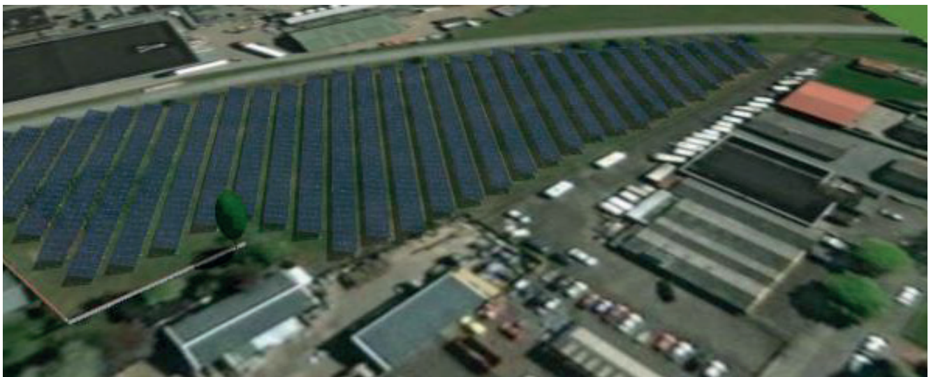
Afbeelding: locatie De Bocht straks (impressie zonneveld)