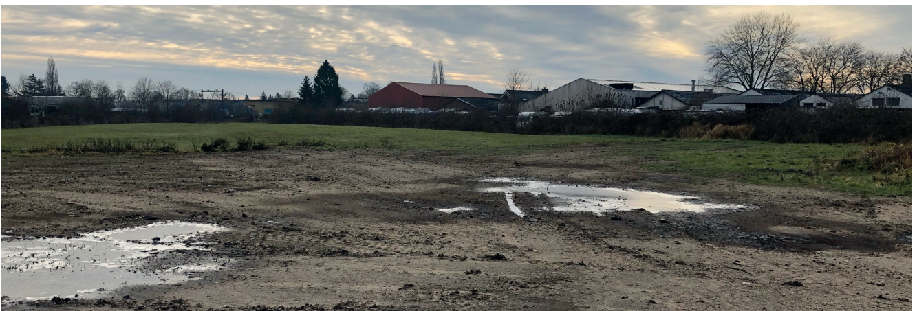
Afbeelding: locatie De Bocht nu

Bij de realisatie van het project zal de initiatiefnemer voor diensten en materialen de voorkeur geven aan lokale toeleveranciers voor diensten en materialen. Hiermee wordt de lokale economie gestimuleerd en het aantal vervoersbewegingen beperkt. Van een initiatiefnemer wordt verwacht dat hiervan alleen gemotiveerd wordt afgeweken.