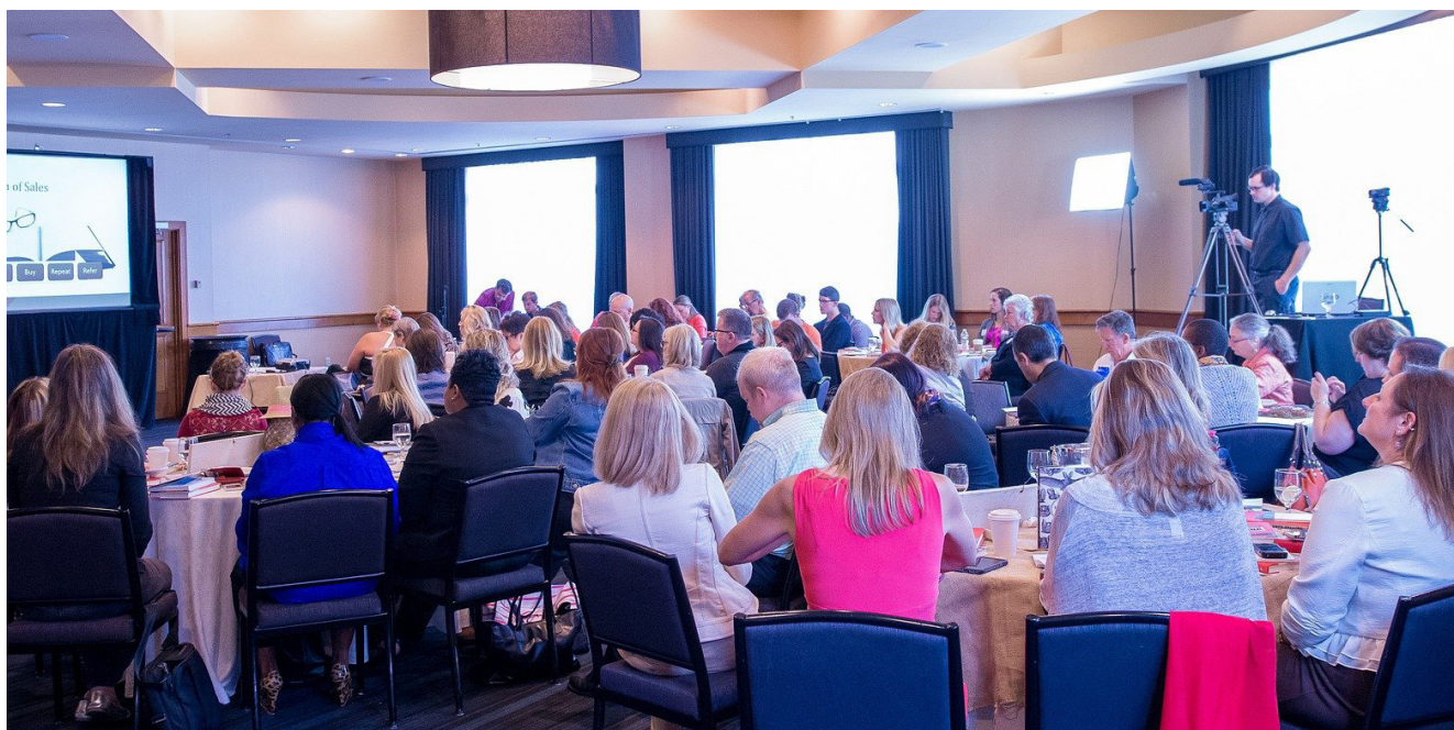
Afbeelding: impressie gebiedstafel, ontwerp- en voorbereidingsbijeenkomst

In fase 2 is de rol van de omgevingsraad meedenken, meewerken, adviseren en beïnvloeden van de beslissing . De gemeente volgt het proces in fase 2 en zal tussentijds contact hebben met zowel de omgevingsraad als de initiatiefnemer over de voortgang en de tussentijdse resultaten. Fase 2 is niet vrijblijvend. Het op een goede manier betrekken van de omgeving is een voorwaarde om door te kunnen gaan naar fase 3. Het advies van de omgevingsraad weegt daarbij mee bij de toetsing door de gemeente.