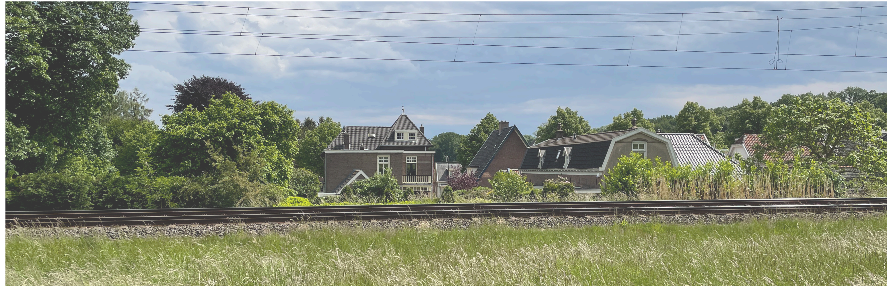
Huidige situatie achterzijde Zutphensestraatweg