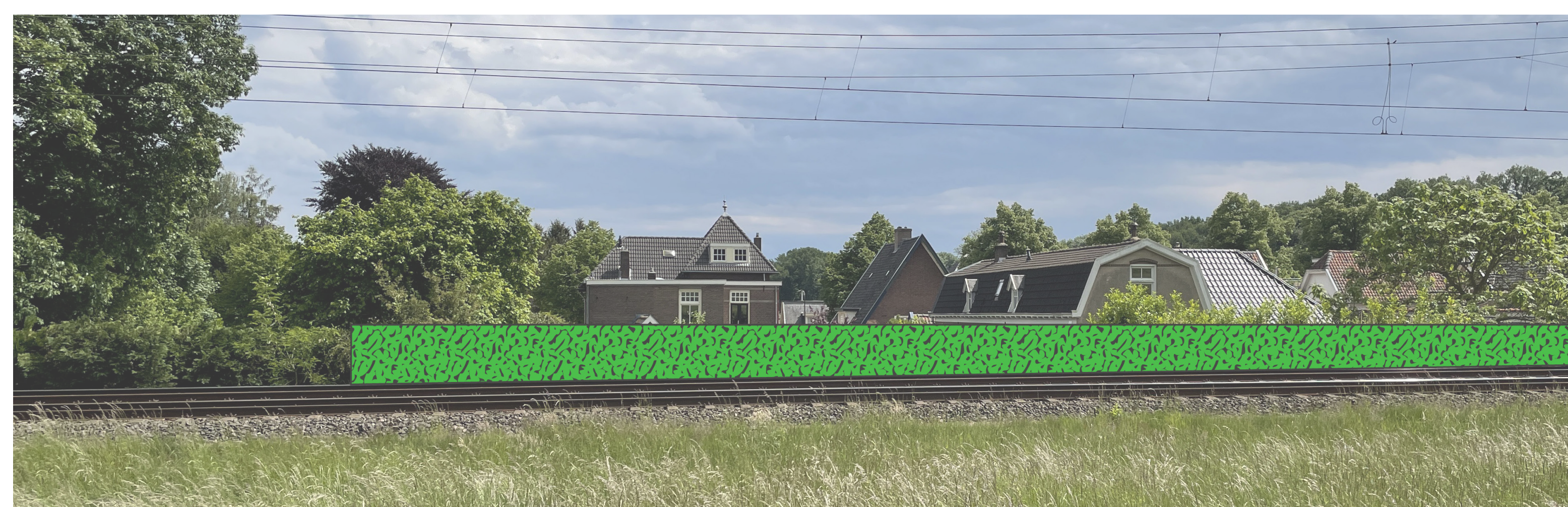
Voorstel gemeente op 6 juli '22: korter scherm, begroeid

Komt overeen met voorstel ProRail op 6 juli '22. Schermvoorstel gaat uit van de volledige lengte zoals ProRail die heeft voorgesteld. Specifiek aandachtspunt: beëindiging scherm dient samen te vallen met de perceelgrens van nr. 45