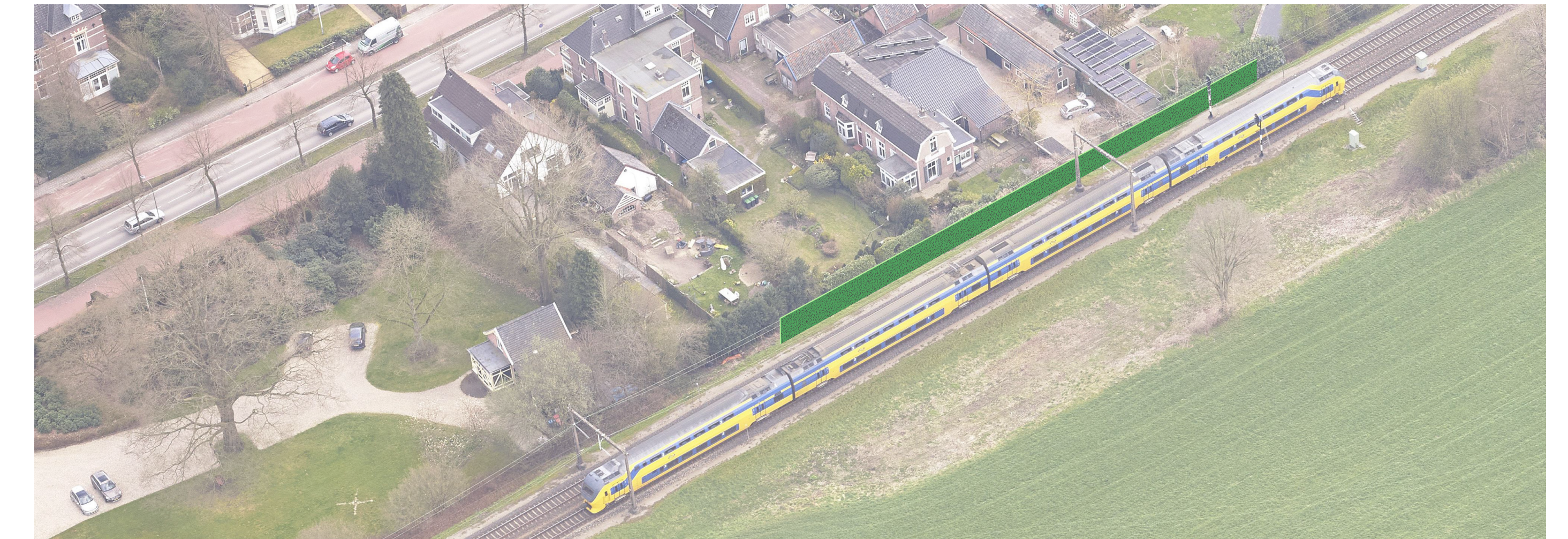
Voorstel gemeente: korter scherm, begroeid