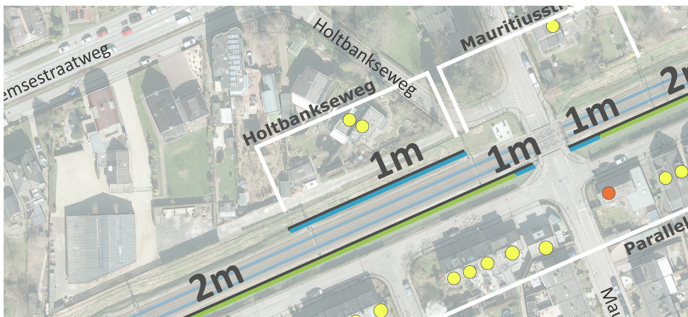
Voorstel ProRail op 27 juni '22 - Scherm 1m dichtbij spoor