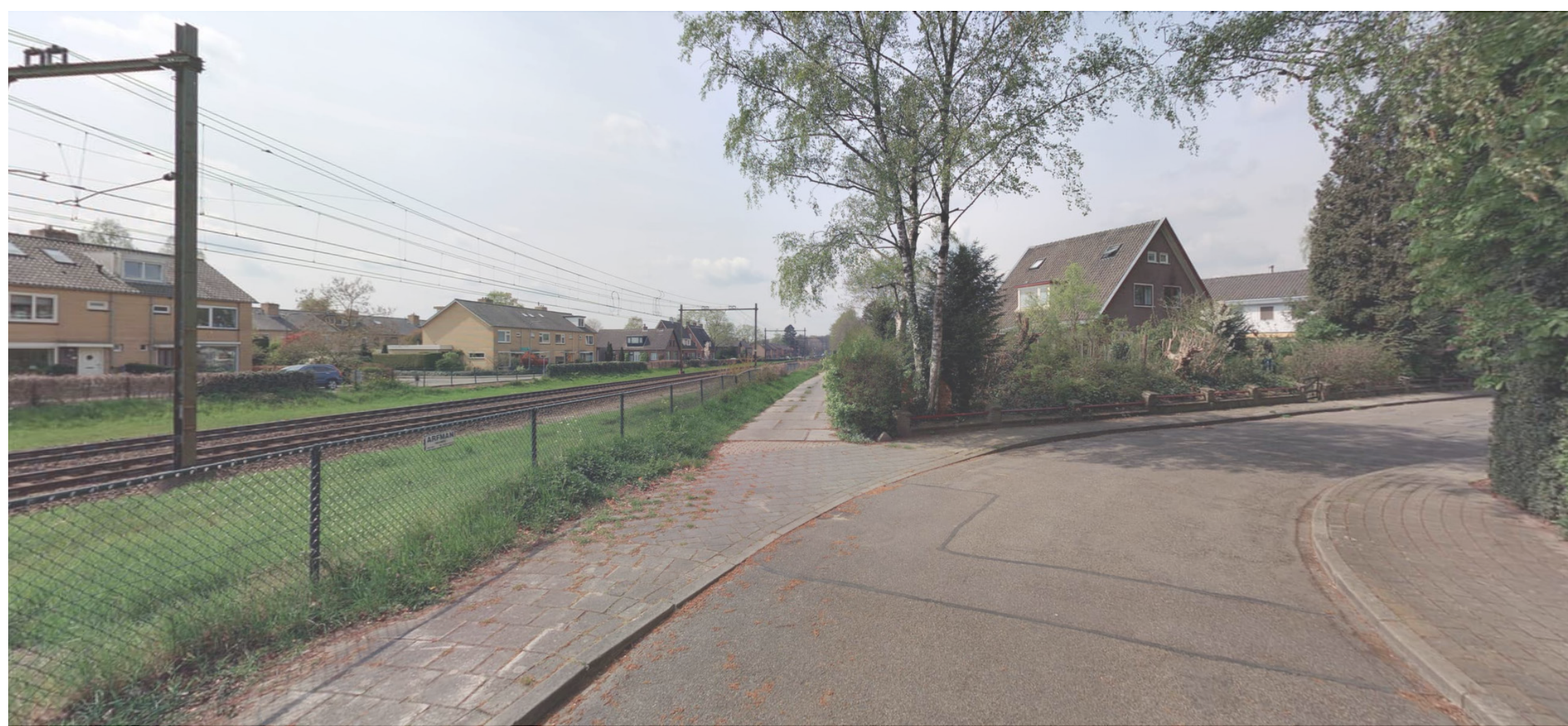
Huidige situatie bij Holtbankseweg