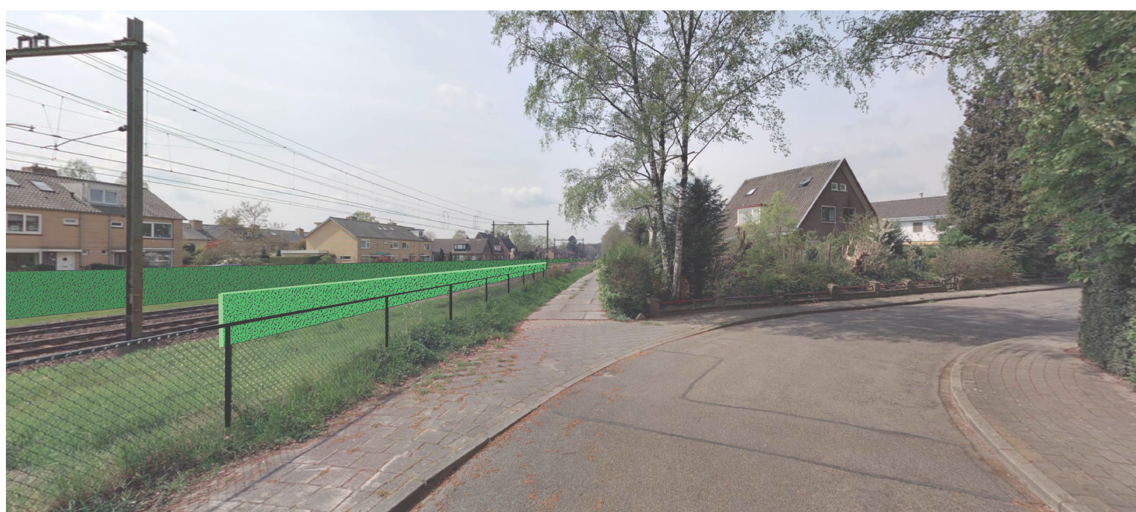
Voorstel ProRail op 27 juni '22 - Scherm 1m dichtbij spoor