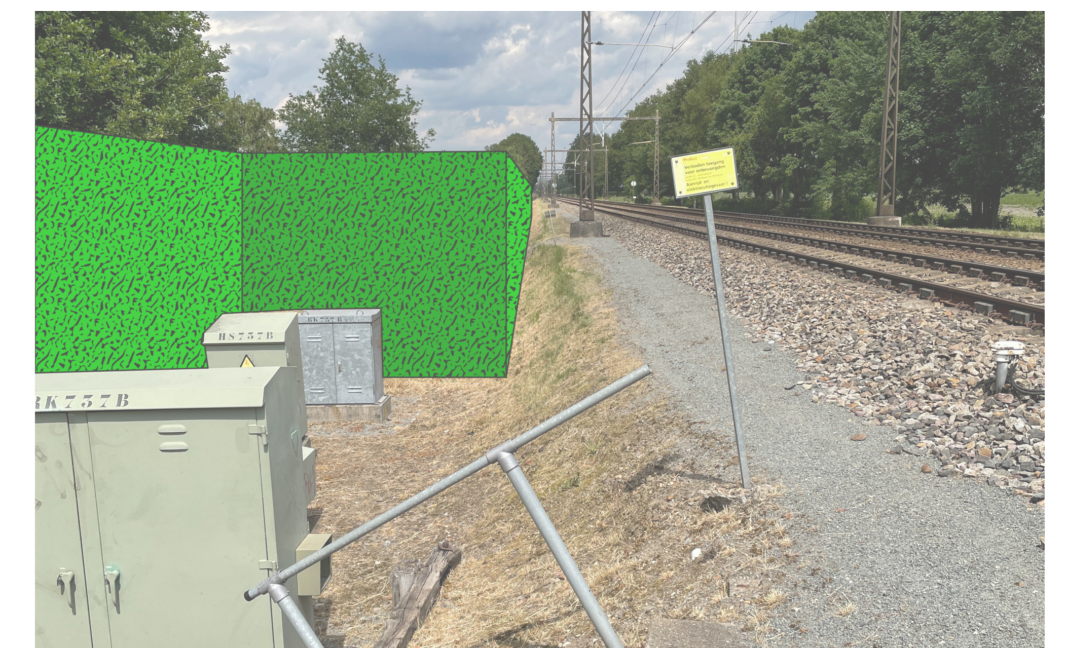
Voorstel ProRail op 6 juli '22, scherm 1,5m t.o.v. spoor