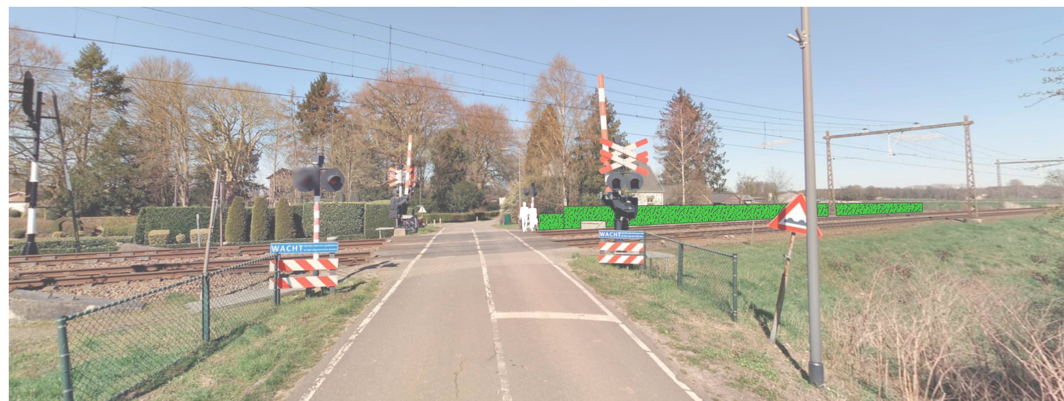
Voorstel ProRail op 6 juli '22: scherm 1,5m (1m) t.o.v. spoor