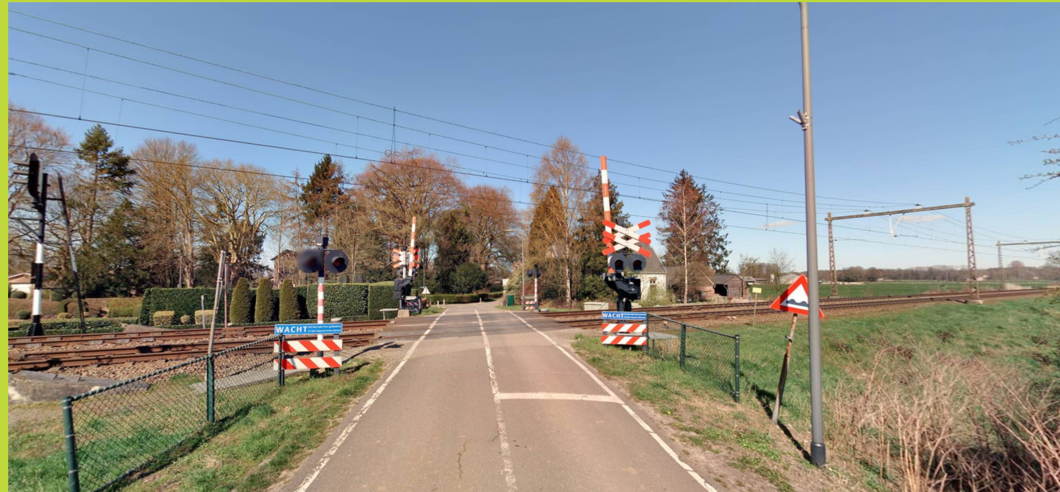
Huidige situatie bij spoorwegovergang Bockhorstweg