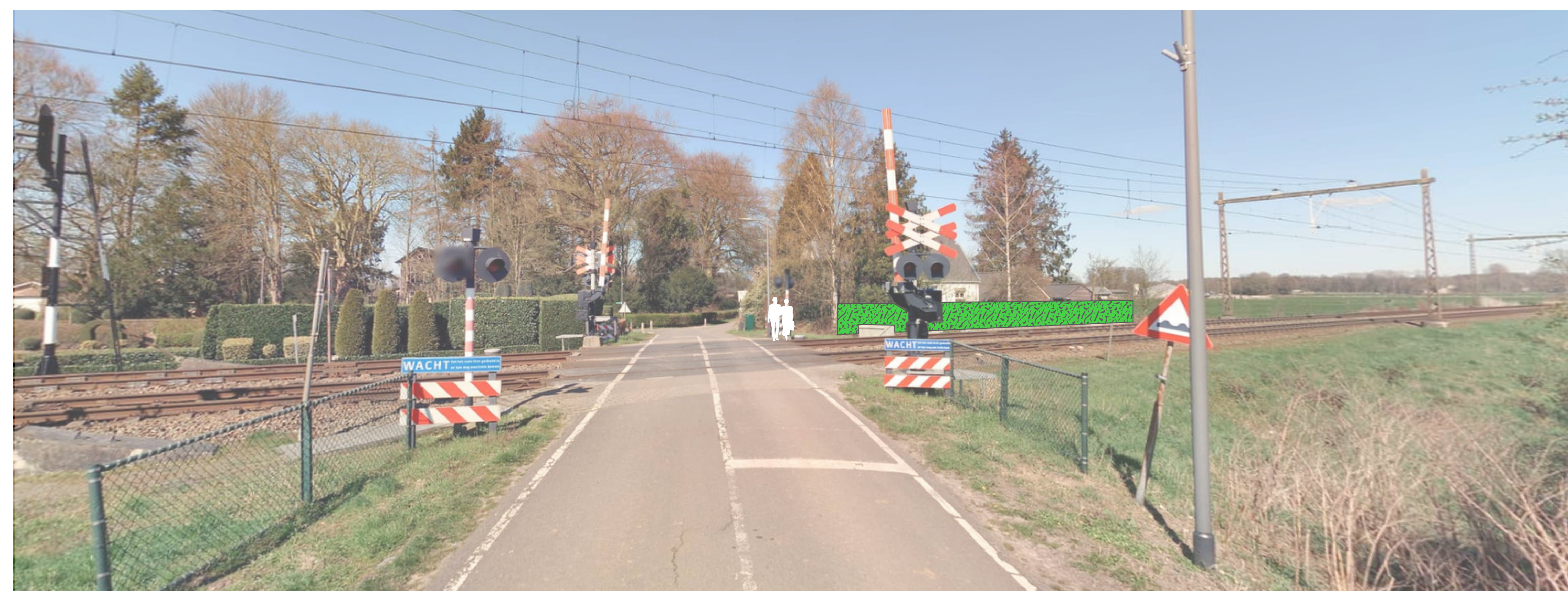
Voorstel gemeente op 6 juli '22: geen scherm of evt. maatwerk bij erfgrans max 2m