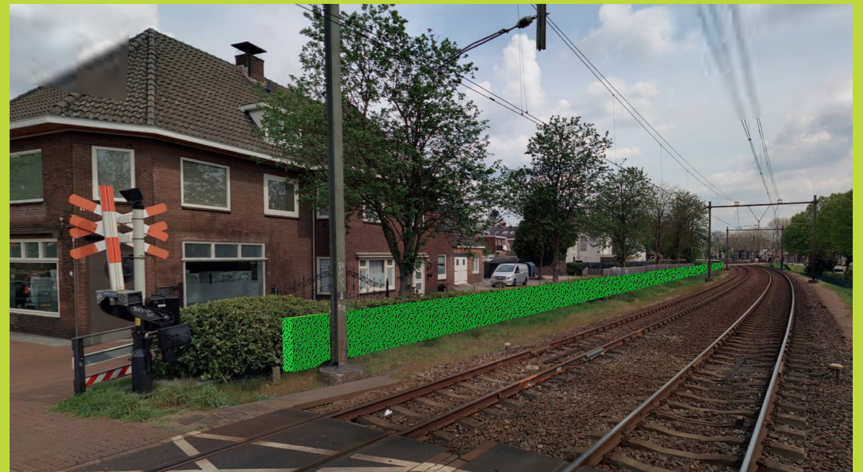
Begroeid scherm 1m op erfgrans, doorlopend vanaf Emmalaan tot President Kennedylaan