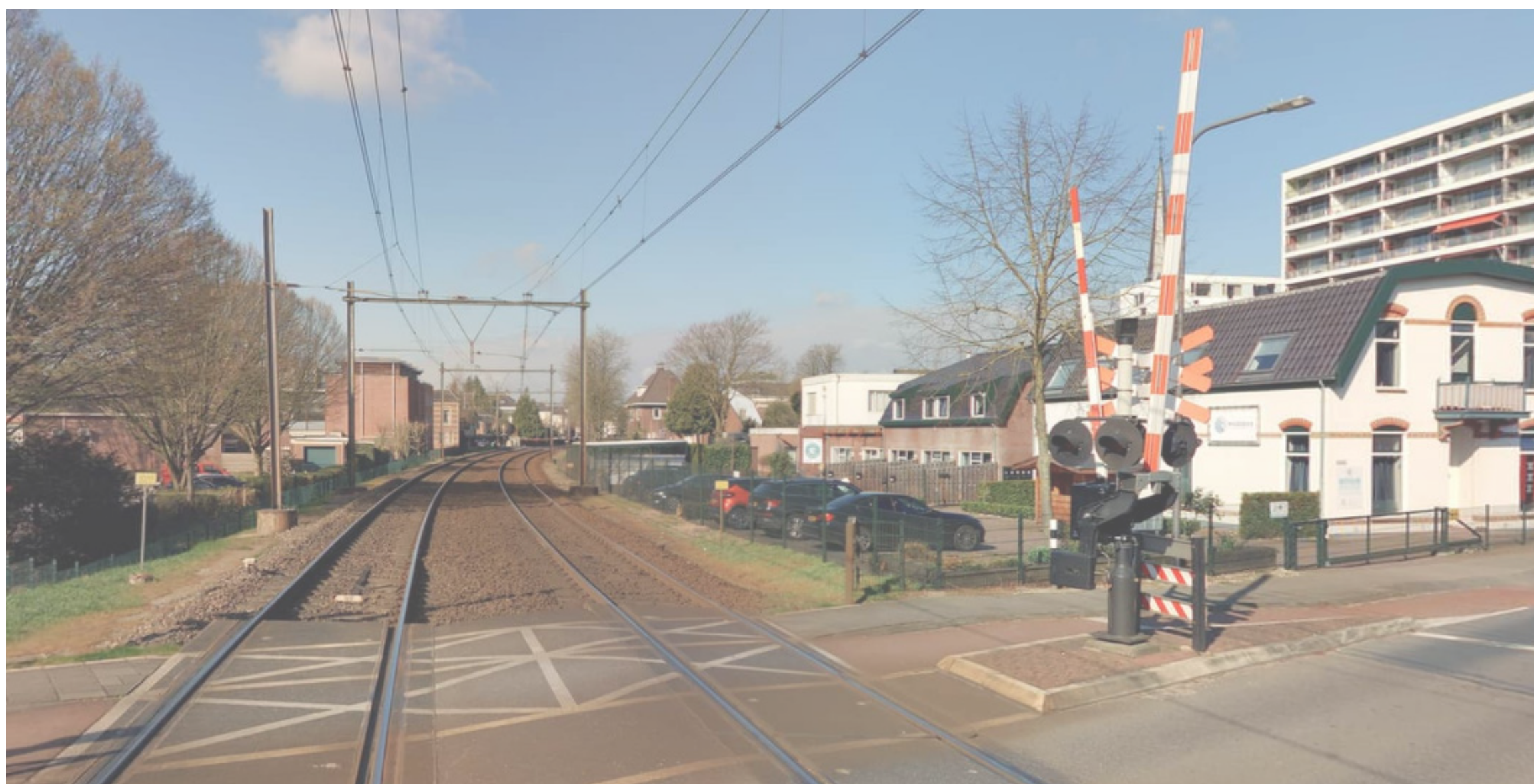
Huidige situatie hoek President Kennedylaan