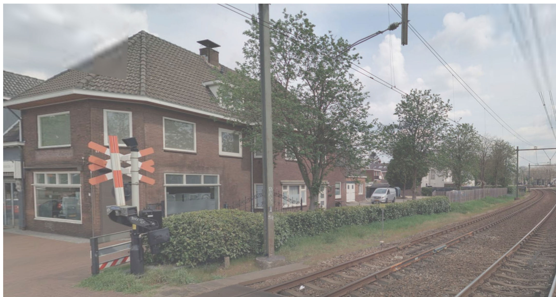
Huidige situatie hoek Emmastraat