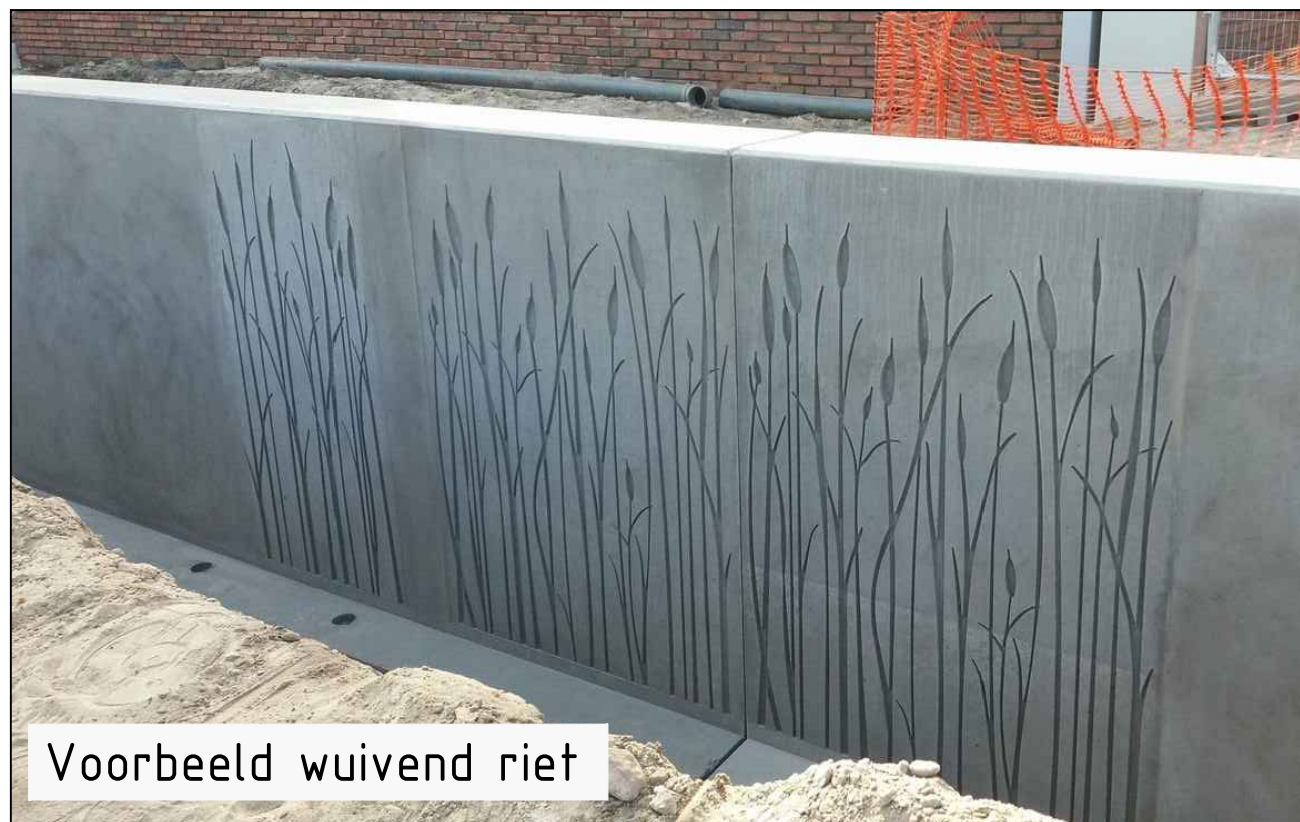
Voorbeeld wuivend riet