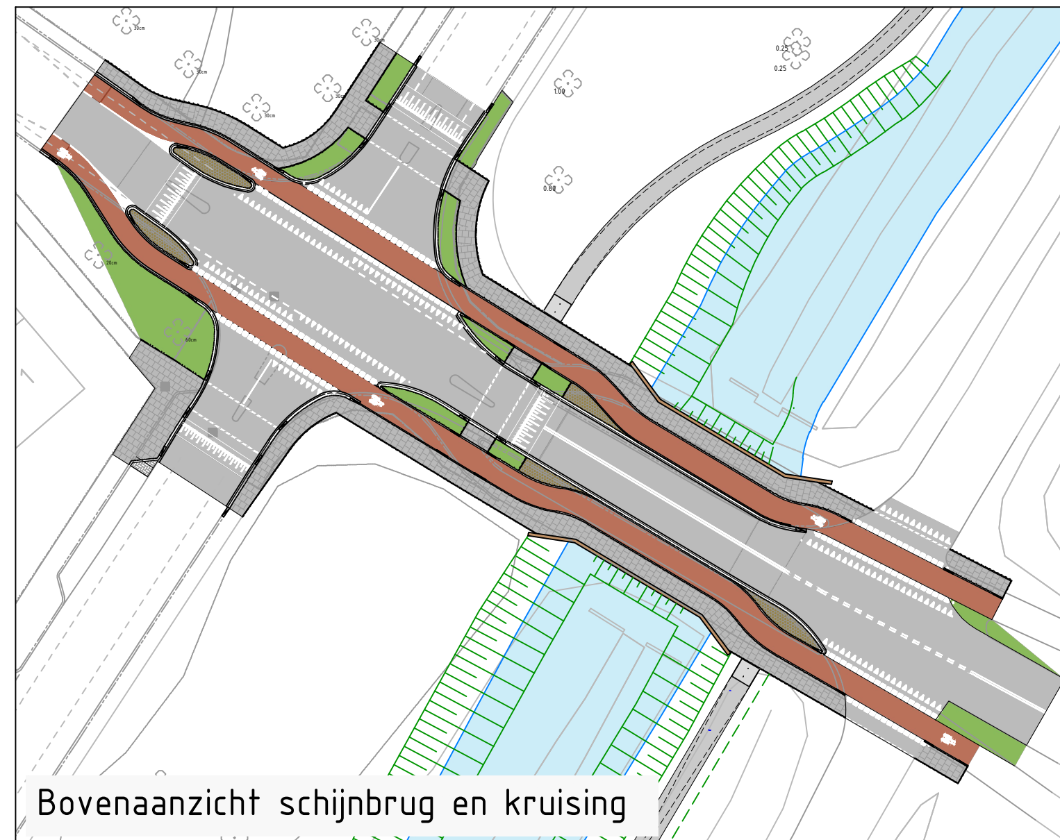
Bovenaanzicht schijnbrug en kruising